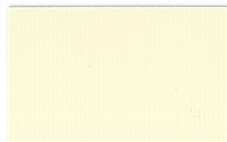
遮熱アイボリー [透光率:1.5%]

※溶着は高周波での縫製(ウエルダー)を推奨します。 ライスター使用時の溶着条件は別途ご相談ください。