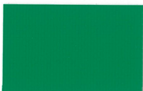
T-09 フォレストグリーン [透光率:0.2%]