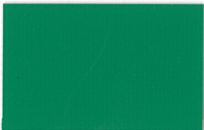
T-07 グリーン [透光率:0.1%]