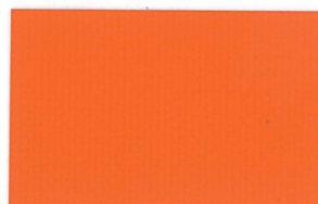
T-12 オレンジ [透光率:2.4%]