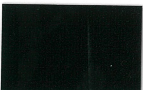
T-20 ブラック [透光率:0.0%]