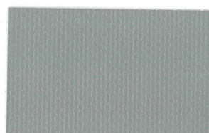
T-21 シルバー [透光率:0.0%]