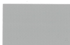
T-19 グレー [透光率:0.4%]