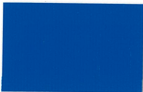
T-01 ロイヤルブルー [透光率:0.0%]