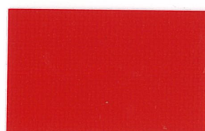
T-13 レッド [透光率:0.7%]