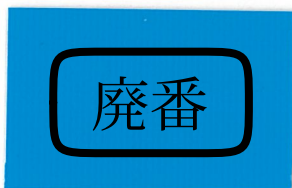
T-02 ライトブルー [透光率:0.1%]