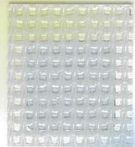
透 明 (透光率：52.5%)